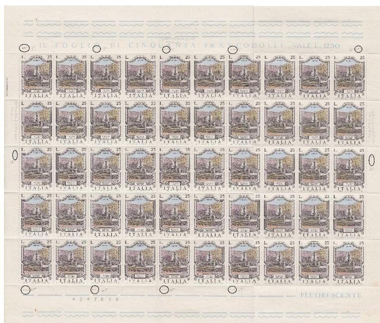
Foglio con la fontana di Palermo