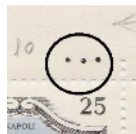
Puntini ufficiali della tavola in corrispondenza del 10° esemplare.